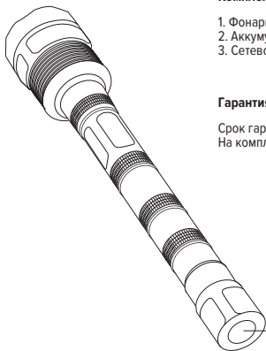
кнопка включения фонаря